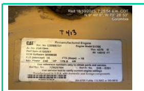
Serie Motor LH